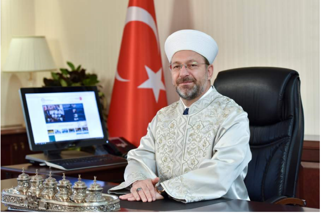
Prof. Dr. Ali ERBAŐ Diyamet İŐleri BaŐkanı